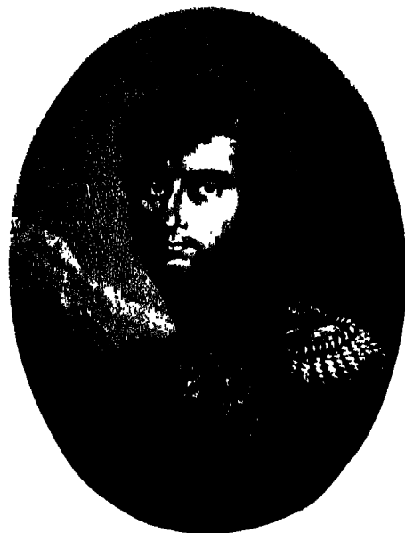
الكونت دو مونطولون.